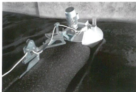
Pojedyńcza jednostka ze sterem